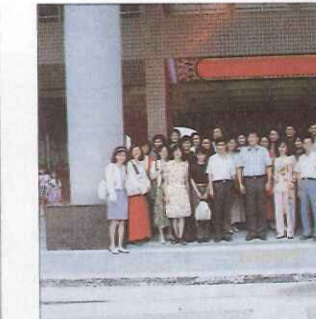
彰化師大參觀本校

今仍記得自己在公車上看到腦性麻痺患者時那驚慌的神情。第一天來到嘉智，迎接我們的是一陣陣歡笑聲與問候語。隨著不斷的腳步，很驚訝地發現自己在不知不覺中已卸下心中的那份多餘的緊張，換上無拘無束的笑容以回報那一张张溫馨而又好奇的面孔。嘉智，真的是一個微笑的世界。 身為第一批義工，抱著「一試試看」心態而來的我們，從來不曾料到會這麼喜歡這份工作，不論是在幫忙打掃教室，或是修剪庭院中的草皮、小樹，對我們而言，都是