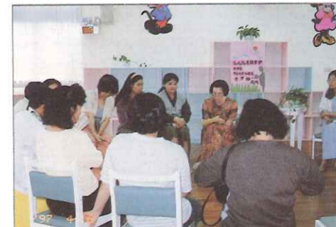
家長成長團——讀書會

雖然無法全程參與，但此次的露營活動，令我感受頗深。至少，經過這次的活動參與，我能以更公平的眼光，看待這群折翼天使；也許，他們在生理或心理上有所缺陷，但他們的潛力卻是不容忽視的。而且，我更佩服他們默默做事的耐心，他們不投機取巧，甚至在整個準備工作中，個個搶著幫忙，相較之下，我們偶爾的懶惰，似乎更不該變很多哪，這正是台語所說的：老師的功勞卡大大。 P.S. (他現在下課或吃晚飯後，常到工廠幫忙，所以那老板多少會一些工資給他。)