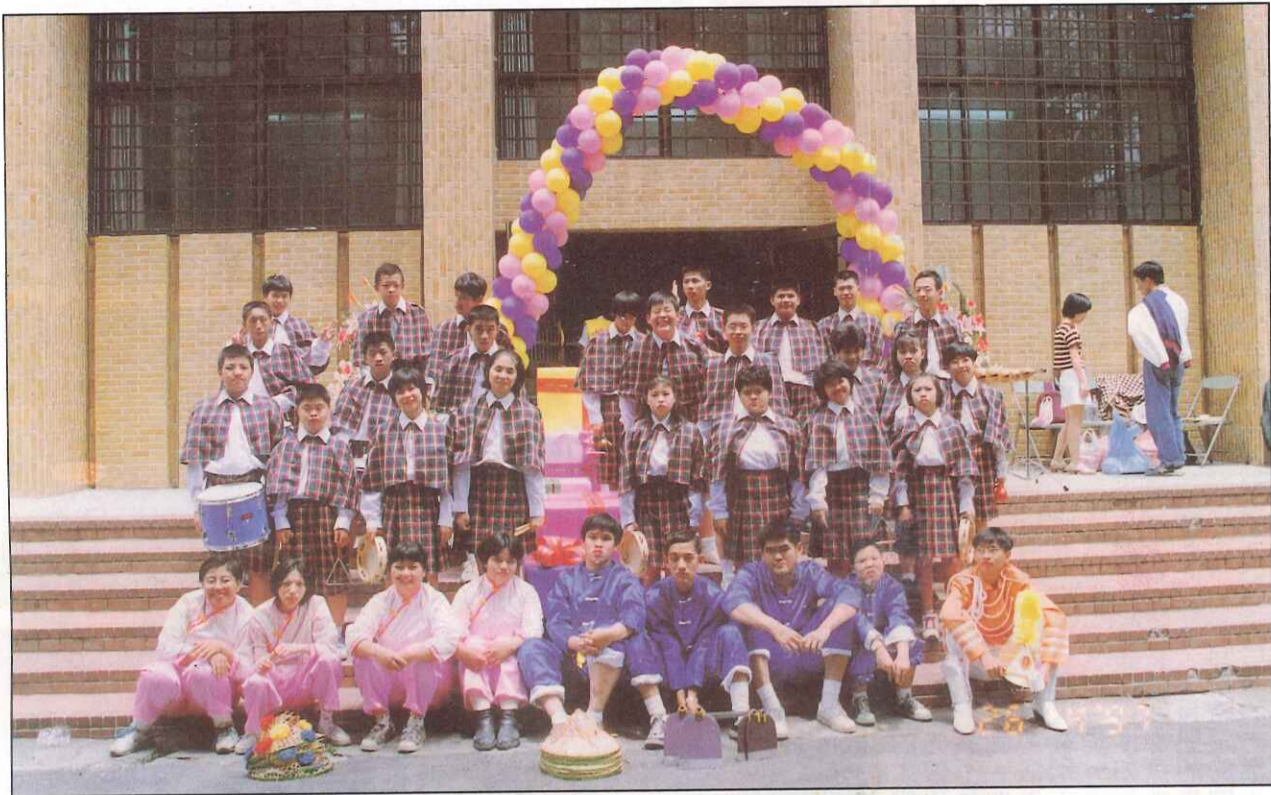
八十五學年度南區才藝表演，本校美麗的队伍打緊樂團